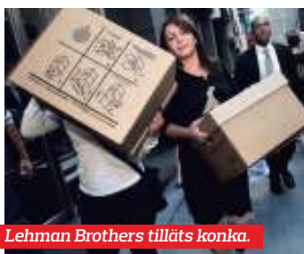
Lehman Brothers tilläts konkra.

– Effekterna blev så gigantiska att inget